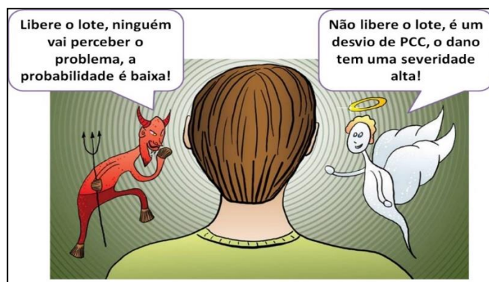
Figura 1 - Ética