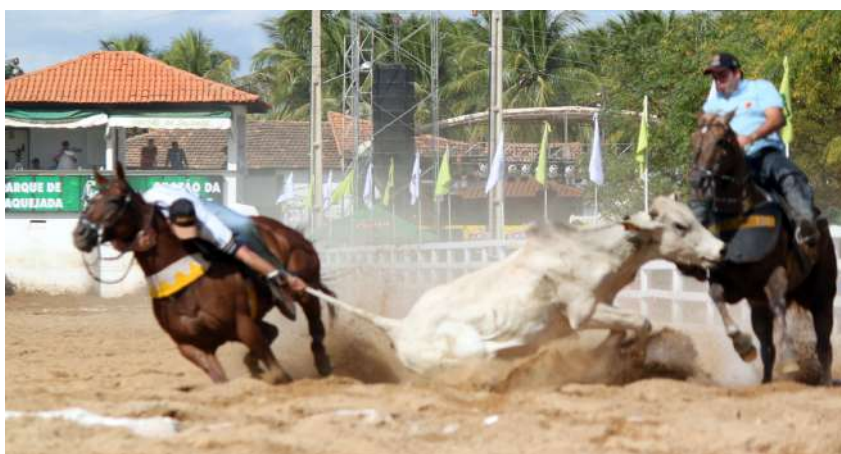
Figura 3. Dúvida do toque da parte superior do boi na primeira faixa (exemplo 2).