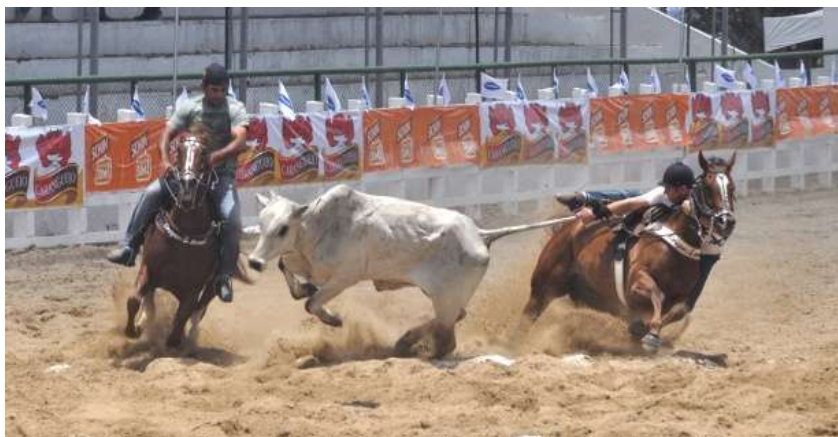
Figura 2. Dúvida do toque da parte superior do boi na primeira faixa (exemplo 1).

Nas Figuras 1, 2, 3 e 4 têm-se casos duvidosos sobre o toque ou não das partes superiores do boi na primeira faixa de pontuação.