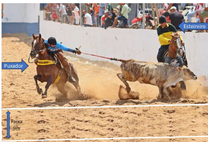
Figura 1. A derrubada do boi em vaquejadas.

A competição, de forma simplificada e de acordo com a regulamentação da ABVAQ, é formada pela disputa entre duplas de vaqueiros (vaqueiro-puxador e vaqueiro-esteireiro) a fim de obter a maior pontuação, através da derrubada do boi. Cada dupla tem o direito de correr, em média, três bois por senha. Para conquistar a derrubada do boi (conhecida como “valeu boi”), o vaqueiro puxador deve derrubar o boi, em uma faixa 9 m de extensão, demarcada por duas linhas feitas com cal, sob o colchão de areia (pista de corrida), conforme representado na Figura 1.