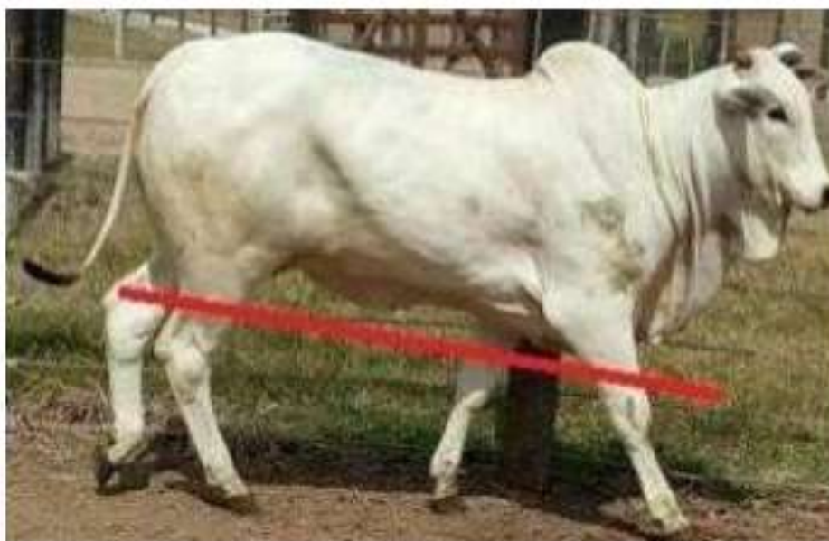
Figura 10. Métrica para considerar a derrubada do boi.

a) É considerada, parte superior do boi, da linha imaginária (Figura 10) onde se localiza o jarrete (joelho ou parte seca) para cima.