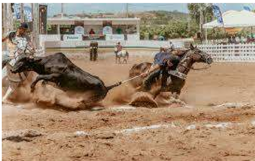
Figura 4. Dúvida do toque da parte superior do boi na primeira faixa (exemplo 3).