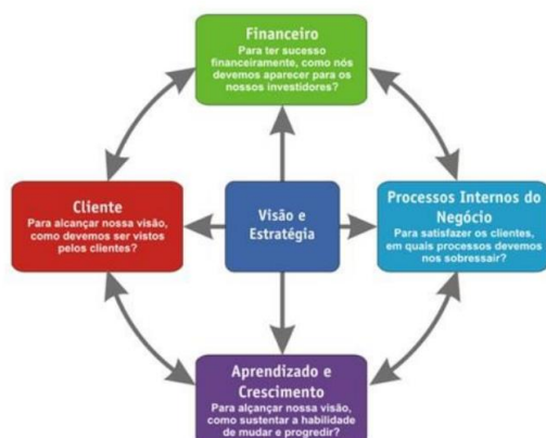
Figura 3 – Evolução do Planejamento Estratégico do DNIT