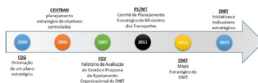
Figura 2 – Evolução do Planejamento Estratégico do DNIT