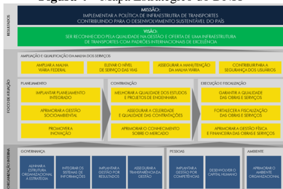
Figura 4 – Mapa Estratégico do DNIT