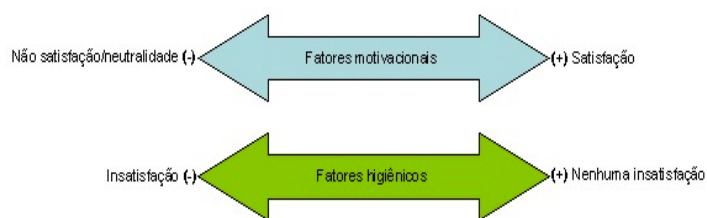
Figura 2: Teoria dos Dois Fatores