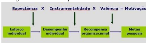
Figura 3: Teoria da Expectância

A Teoria da Expectativa baseia-se em três mecanismos, a valência, a instrumentalidade e a expectativa. Apresentando os seguintes conceitos: a) Valência ou atratividade de recompensa: é a valorização de seu esforço pelo trabalho realizado; b) Força ou instrumentalidade: é a crença de que o desempenho do trabalho, de forma específica, poderá resultar em uma recompensa positiva; c) Expectativa: é a relação entre valor e força, quando o indivíduo precisa identificar o quanto deve se esforçar para alcançar um bom desempenho. Representado como: Força da motivação = valência x instrumentalidade x expectativa (VROOM, 1964), conforme a Figura 3: