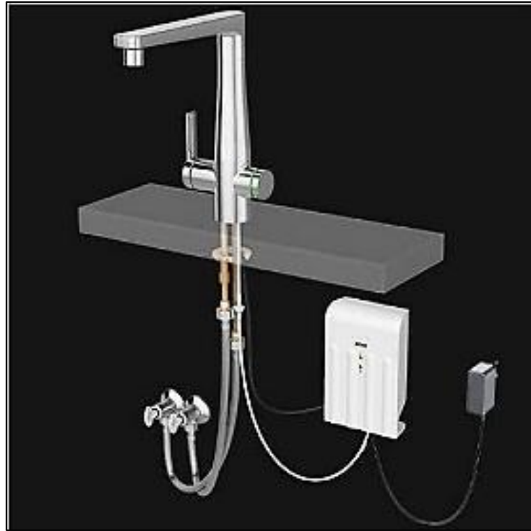
Figura 2 - torneira monocomando para cozinha Docol Ozônio