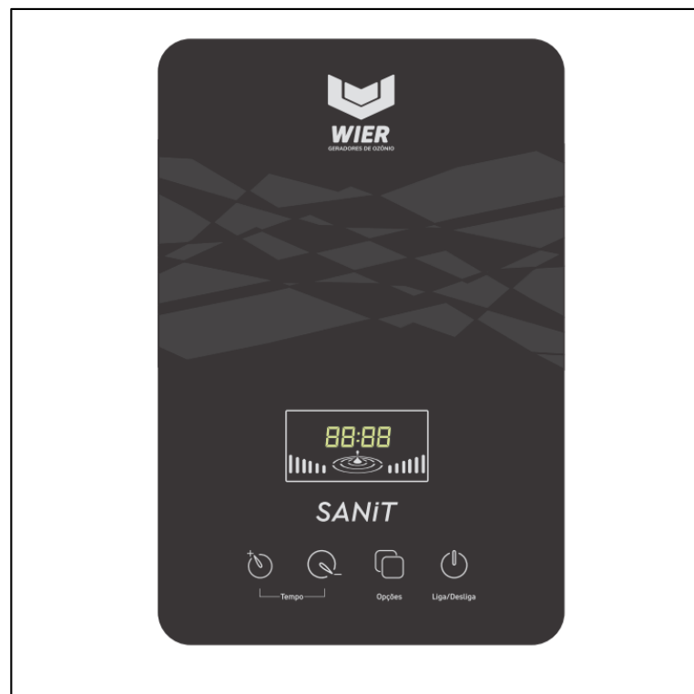
Figura 4 - Gerador de Ozônio SANIT

umidade relativa, o tempo de contato e a concentração do ozônio. Além disso, a sua ação é fundamentalmente superficial e sua eficácia depende da temperatura e do pH do meio, do tipo do produto, grau de contaminação e sensibilidade do microrganismo. É importante que o projeto seja adequado aos equipamentos ou instalações para o tratamento, na fase gasosa ou aquosa, bem como conhecer a demanda de ozônio do meio, de forma a distinguir entre a dose de ozônio aplicada e o ozônio residual necessário (BATALLER-VENTA; CRUZ-BROCH; GARCÍA-PÉREZ, 2010). É possível encontrar modelos de geradores de ozônio destinados às atividades de sanitização de alimentos, desde frutas até legumes, como o apresentado na figura 4.