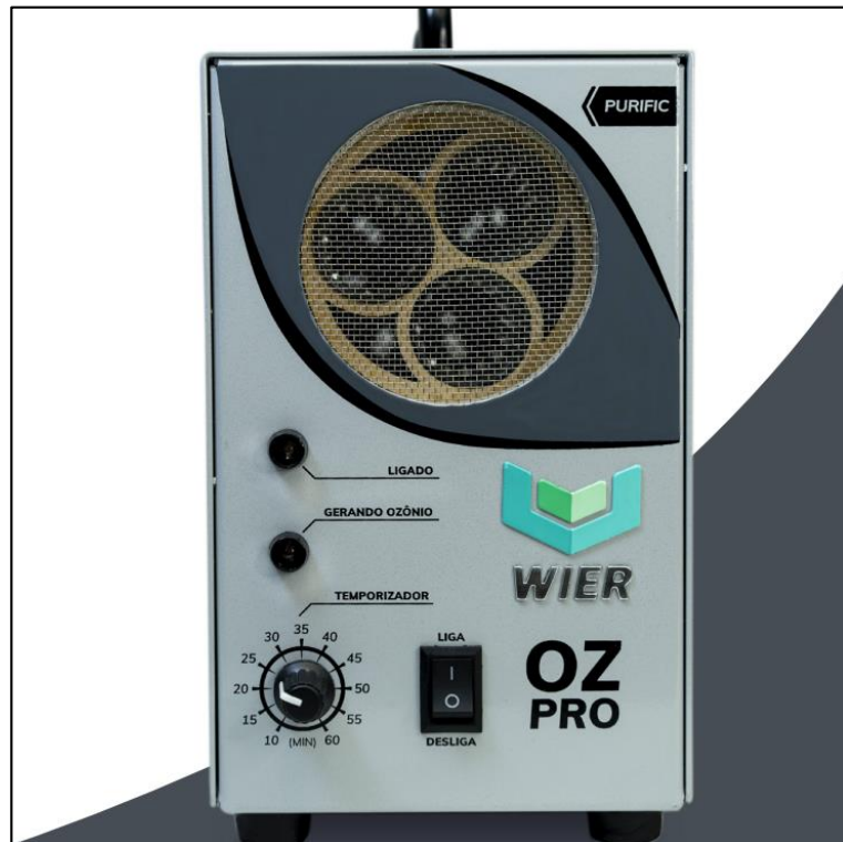
Figura 6 - Gerador de Ozônio OZpro