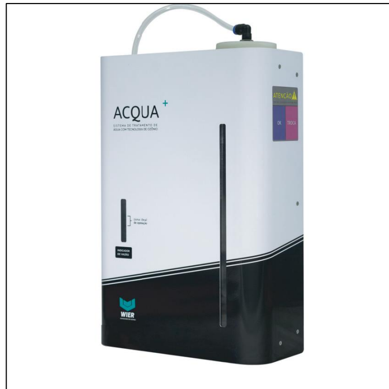
Figura 3 - Sistema de Ozônio WIER ACQUA+ para tratamento de Água de Piscinas Residenciais