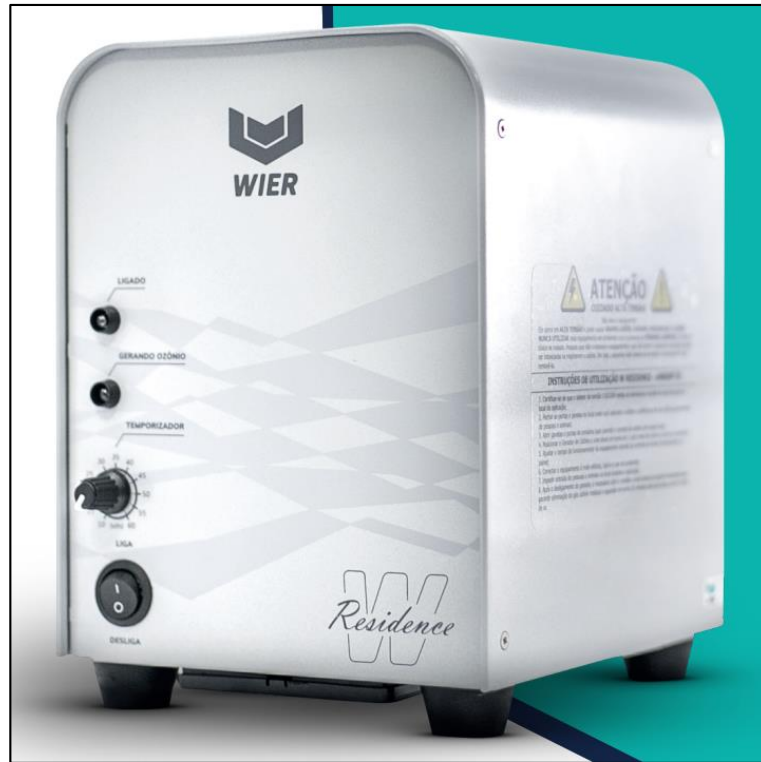
Figura 5 - Gerador de Ozônio W RESIDENCE