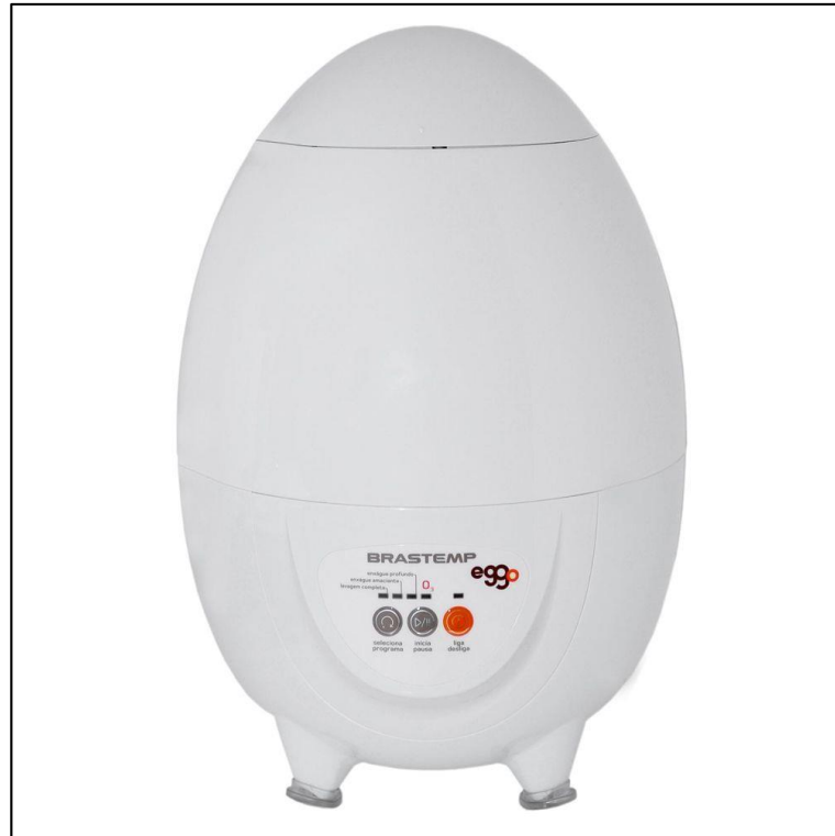
Figura 7 - Minilavadora Brastemp 1Kg - BWI01A

ciclo de ozônio (figura 7), indicado para lavagem, higienização e desodorização de peças de roupas mais delicadas (VASQUES; ONO, 2010).