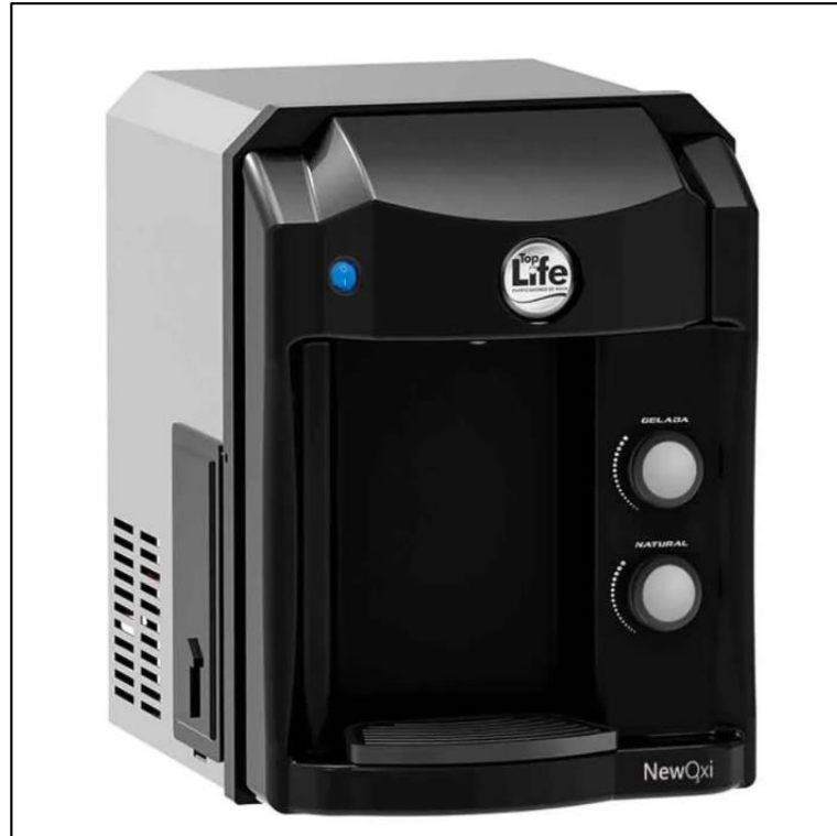
Figura 1 - filtro de água com ozônio Top Life - purificador refrigerado

gerador de ozônio, por onde é possível produzir água ozonizada, a qual atua não apenas como um filtro, mas também faz a desinfecção da mesma (figura 1). 2) a torneira de pia com gerador de ozônio, que associa segurança e praticidade de uso (figura 2).