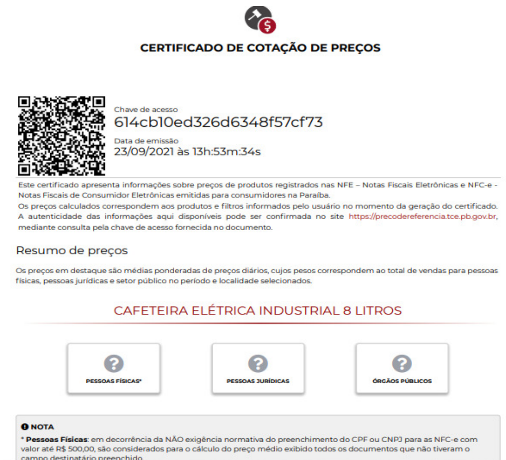
Figura 1: Tela do Processo administrativo da aquisição da cafeteira – Certificado gerado pela Plataforma Preço de Referência