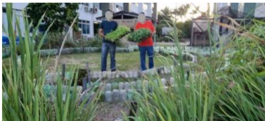
Figura 8 - Mudas de hortaliças

A seleção das mudas de hortaliças para plantio foi aleatória, e adquiridas de um viveiro localizado na comunidade rural Mata Redonda, município de Pedras de Fogo – PB, onde existia estoque e disponibilidade para o momento em questão. Trabalhou-se com alface-crespa verde e roxa ( Lactuca sativa ), e pimentão verde ( Capsicum annuum ). Através de propagação pelos bulbilhos, plantou-se o alho ( Allium sativum ) e, por sementes, plantou-se o coentro ( Coriandrum sativum ). Havia espécies já existentes, as quais foram mantidas na mandala, em sua maioria eram espécies medicinais ou aromáticas como: capim santo ( Cymbopogon citratus ), erva cidreira ( Melissa officinalis ), bredo ( Amaranthus viridis ), capim limão ( Cymbopogon citratus ), entre outras, utilizando o policultivo característico das Mandalas (Figura 8).