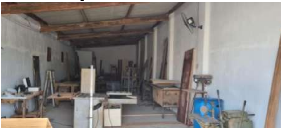
Figura 6 – Marcenaria e seus resíduos.