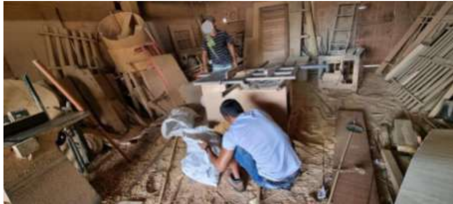
Figura 5 – Marcenaria e seus resíduos.