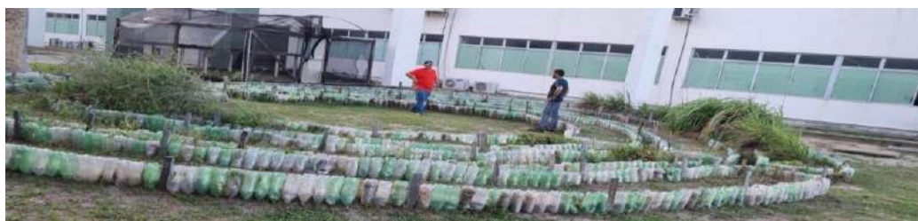
Figura 1 – Mandala de garrafas PET no IFPB campus Cabedelo.

Foi construída uma horta reativando um canteiro estilo Mandala, na área principal do bloco de aulas do curso de Técnico em Meio Ambiente, no campus Cabedelo do Instituto Federal da Paraíba (IFPB) (Figura 1). A referida mandala foi construída demarcando-se o terreno, em semicírculos concêntricos, com o auxílio de garrafas descartáveis de refrigerante, tipo PET (Polietileno Tereftalato), que é um polímero termoplástico. Cada canteiro possuía aproximadamente 1,20 metros de largura; os referidos anéis possuíam espaços que os interligavam e que possibilitavam o trabalho de pessoas na referida horta. A “Mandala” já existia, sendo necessário reparos, os mais diversos, em sua estrutura, bem como em sua área produtiva.