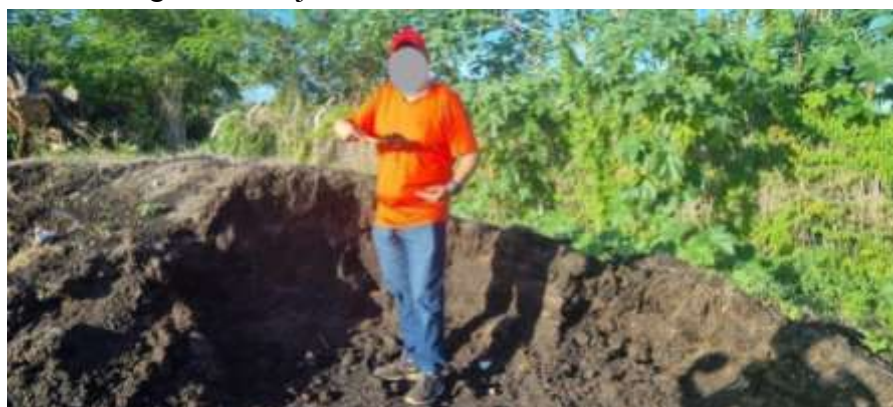
Figura 7 – Rejeito de borra de café em terreno baldio.