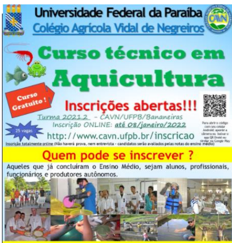
Figura 2 Divulgação do curso técnico para o público geral