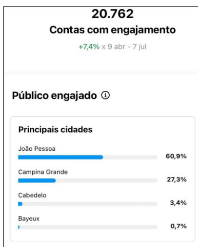
FIGURA 1 – Análise por Municípios que apresentaram mais engajamento no período de 90 dias do recorte do estudo.