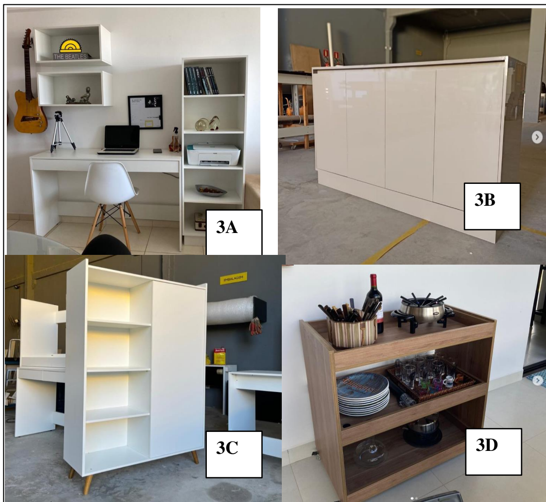
FIGURA 3A, 3B, 3C e 3D – Imagens correspondentes aos móveis/combos que possuem maior taxa de vendas na empresa Mini Marcenaria, João Pessoa-PB.

Para análise dos dados decidiu-se trabalhar com os 4 combos ou móveis mais vendidos e procurados na fábrica da Mini Marcenaria (conforme figura 3A, 3B, 3C e 3D), a fim de compreender a procura e o feedback dos clientes nos móveis. Todo esse contexto com alcance orgânico em um puro marketing digital em meio a uma pandemia mundial.