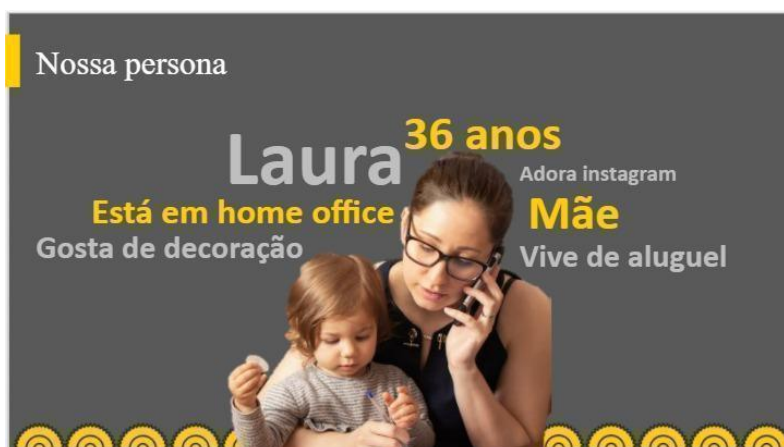
FIGURA 4 – Persona da Empresa Mini Marcenaria, método de aproximação com os clientes para captação e fechamento de vendas no público alvo da marcenaria em João Pessoa-PB.

Sobre a persona da empresa em estudo (Figura 4) - Mini Marcenaria – os colaboradores apelidaram com o nome de “Laura”, e suas principais características são usadas como modelo a ser seguido nas publicações. Por motivos de que a maioria do público da empresa possui características bastante semelhantes ao da persona. A Laura citada acima possui 36 anos, adora Instagram, está em home office, gosta de decoração e vive de aluguel. Características essas, coletadas através dos resultados das vendas e informações que o marketing digital proporciona.