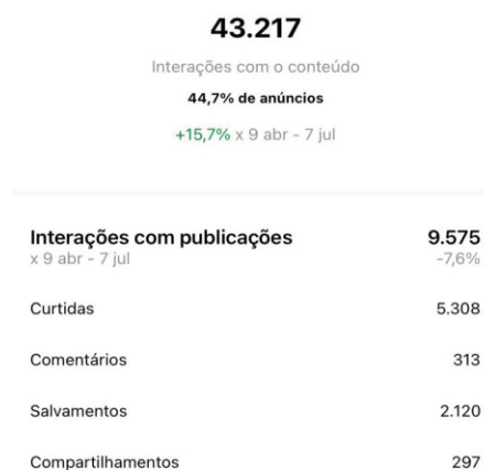
FIGURA 2 – Dados numéricos do engajamento por postagens em curtidas, comentários, compartilhamento e salvamento no período de 90 dias do recorte do estudo.