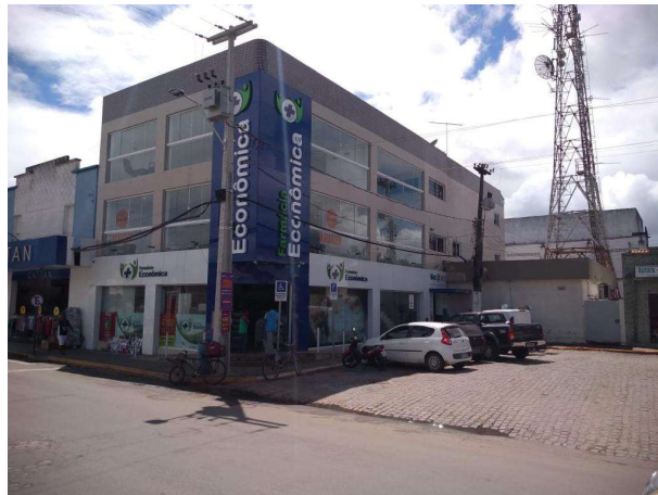
Figura 2. Fachada - Farmácia Econômica