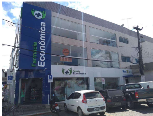
Figura 3. Fachada - Farmácia Econômica