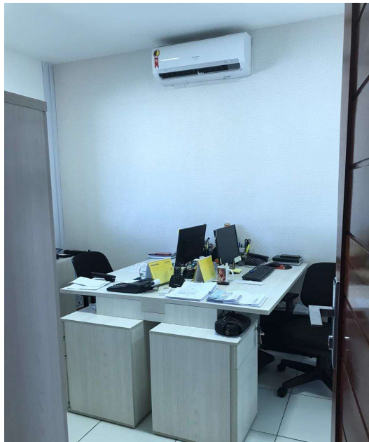
Figura 4. Escritório - Farmácia Econômica