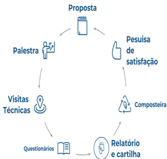
Figura 1: Organograma da proposta da pesquisa

As técnicas de ensino deverão ser aplicadas, com a adequação de cada técnica e tecnologia com associação e o meio produtivo são imprescindíveis para o sucesso da ação. A pesquisa é parte preponderante, pois através de estudos anteriores serão edificadas as teorias de ciclagem de nutriente e sua ação no solo. Conforme organograma abaixo, representado pela Figura 1.