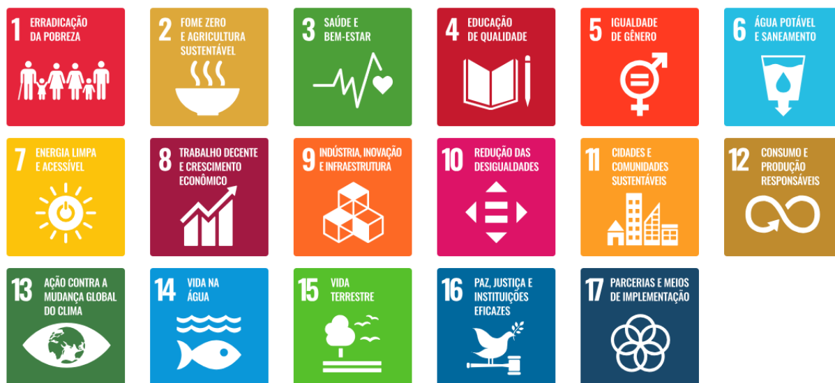
Figura 2 – Objetivos de Desenvolvimento Sustentável no Brasil.