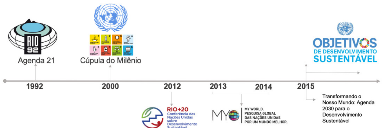
Figura 1 – Agenda global de desenvolvimento

Na perspectiva de minimização dos danos ao meio ambiente e colaborando com a discussão da temática de educação ambiental, ao longo da história inúmeros eventos internacionais surgem vista a estabelecer objetivos, medidas e planos com foco no desenvolvimento sustentável do ambiente e do planeta. Conforme pode-se observar na figura 1, que elenca os principais marcos históricos presentes na linha temporal de luta em prol ao desenvolvimento sustentável do planeta terra.