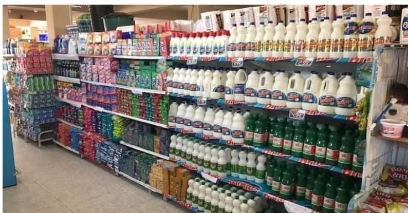
Figura 3: Seção de Limpezas