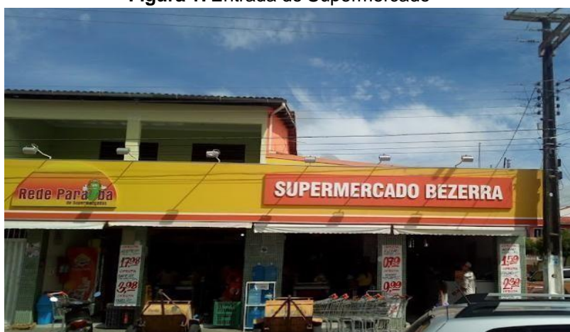
Figura 1: Entrada do Supermercado

O estágio foi feito na empresa que tem como razão social Coaly Comércio Alimentícios, com o nome fantasia Supermercado Bezerra, Rede Paraíba, que fica situada na rua Praça João Ferreira da Silva, nº 334, Centro, CEP: 58240 - 000, na cidade de Tacima - PB, com CNPJ 00.753.906/0001-87, com 4070 2 de área. A seguir, encontram-se algumas fotos do supermercado: fachada e algumas do interior do supermercado (Figuras 1 a 5).