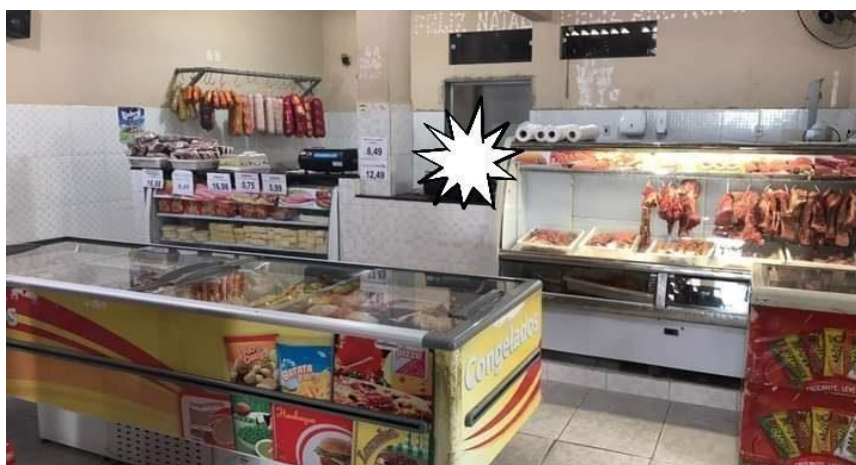
Figura 4: O Açougue

A Figura 3 mostra uma parte da seção de limpezas do supermercado, como pode se observado, as prateleiras são bem organizadas e de fácil visualização para o consumidor.