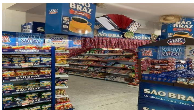
Figura 2: Interior da Empresa