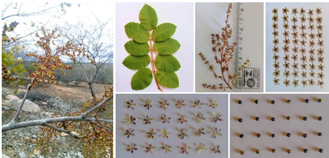
Figura 2 Detalhes da flor, folha e fruto de plantas de Lithraea molleoides coletados em áreas de mata nativa do Bioma Caatinga.

L. molleoides caracteriza-se por apresentar tronco curto e tortuoso, ramificação dicotômica ou irregular e uma copa paucifoliada. As folhas são compostas e variam de 5 a 7 folíolos opostos, ovalados e que possuem tamanho médio de 5 cm de comprimento por 3 cm de largura. As flores fazem parte de uma inflorescência, são masculinas, sésseis, pequenas e hermafroditas. O fruto é caracterizado como drupa globosa, de coloração preta com cálice persistente. Já a semente é periforme, orbicular e de coloração marrom, possuindo um tegumento membranáceo (Figura 2) (CARVALHO, 2003).