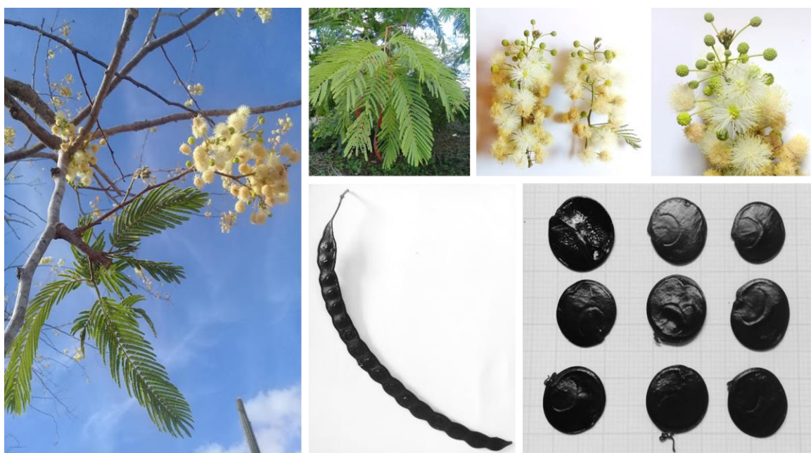
Figura 1 Detalhes da folha, flor, fruto e semente de plantas de Anadenanthera colubrina coletados em áreas de ecossistema natural do Curimataú paraibano.

De acordo com a classificação botânica, o angico apresenta folhas compostas bipinadas e paripinadas, sendo que em cada folha são encontrados, em média, de 15 a 35 pares de pinas multifoliolados. Estes folíolos são caracterizados como lineares, assimétricos, obtusos e com costas médias centralizadas. As flores fazem parte de uma inflorescência terminal, possuem coloração branca-amarelada e são bastante atrativas aos insetos polinizadores. O fruto é caracterizado como deiscente, coriáceo, estreito e de coloração marrom-escuro, contendo de 5 a 15 sementes. As sementes possuem coloração escura, são brilhantes, orbiculares, achatadas e possuem um comprimento médio de 15 mm (Figura 1) (CARVALHO, 2002).