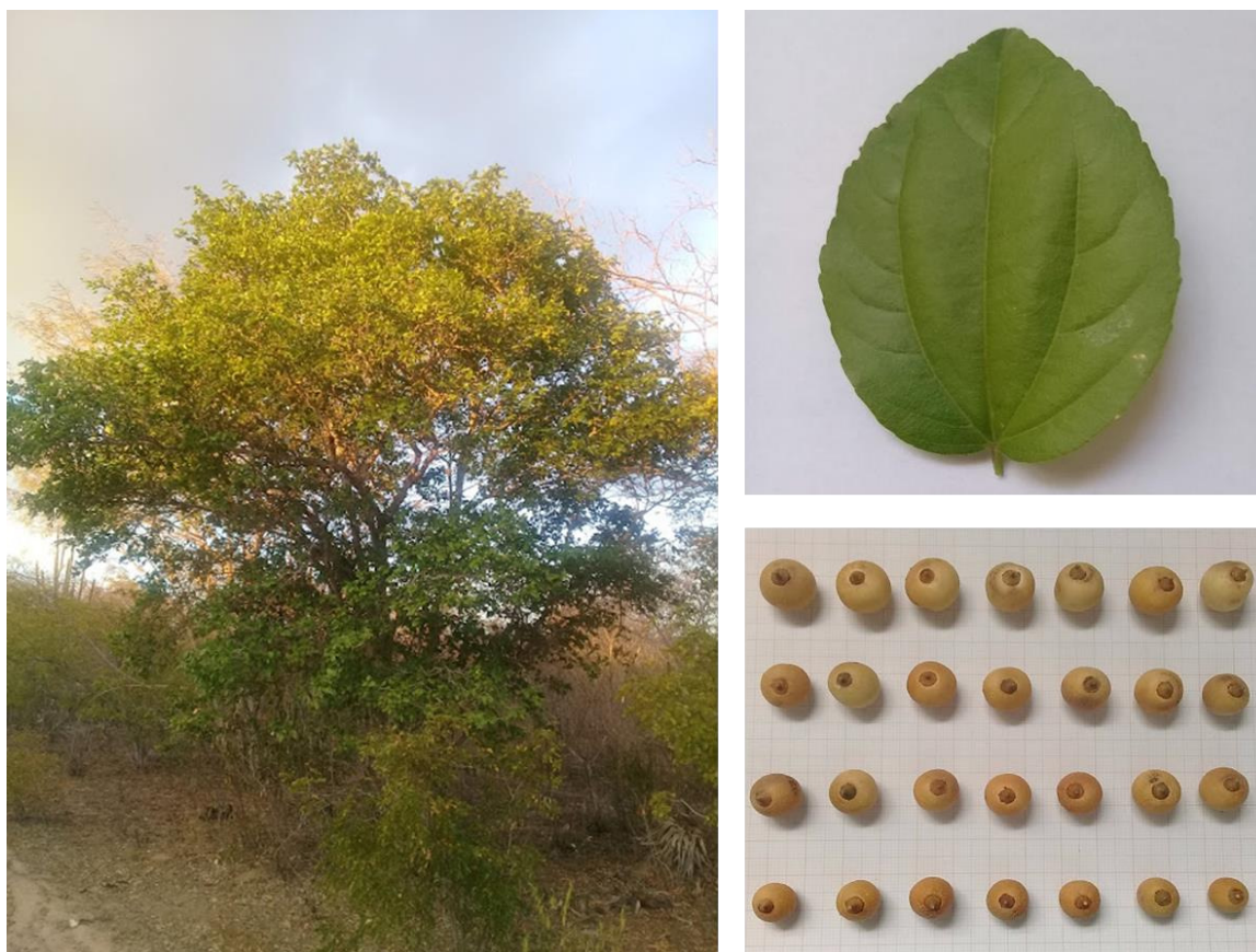
Figura 4 Detalhes do porte, folha e fruto de plantas de Ziziphus joazeiro coletados em áreas de ecossistema natural do Bioma Caatinga.

4). As flores possuem coloração amarelo-esverdeada e fazem parte de uma inflorescência que emergem em cimas axilares de forma globulosa, contendo, em média, de 15 a 35 flores. O fruto é do tipo drupa, de coloração amarela, carnoso e de sabor adocicado, o qual contém uma semente do tipo poliembriônica, rígida e de difícil germinação (CARVALHO, 2007).