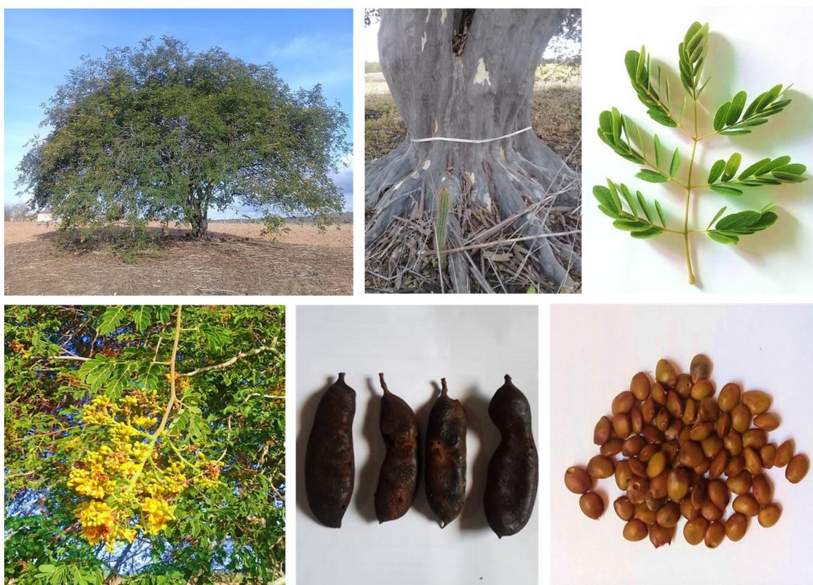
Figura 5 Detalhes do porte, tronco, folha, flor, fruto e semente de plantas de Caesalpinia ferrea coletados em áreas de mata nativa do Bioma Caatinga.

A espécie caracteriza-se por ser uma planta perenifólia de grande porte, podendo atingir de 6 a 10 m de altura, dependendo das condições edafoclimáticas do local onde está situada. Apresenta tronco baixo, ramificação dicotômica e galhos irregulares. A casca possui coloração acinzentada, é lisa e fina, podendo atingir uma espessura média de 0,20 cm. As folhas são compostas por um conjunto de pinas contendo de 4 a 6 folíolos, que se caracterizam pelo formato glabro, oblongos e quebradiços. As flores são amarelas, lúteas, pequenas e bastante atrativas aos polinizadores. Estas, por sua vez, encontram-se dispostas em panículas terminais, compondo uma inflorescência (CARVALHO, 2010). O fruto é um legume indeiscente, glabro, de coloração castanho-escuro e formato achatado. As sementes são caracterizadas como pouco assimétricas, biconvexas e de coloração marrom-escuro, possuindo tamanho médio de 0,91 cm de comprimento por 0,61 cm de largura (Figura 5) (ANDRADE JÚNIOR et al., 1996).