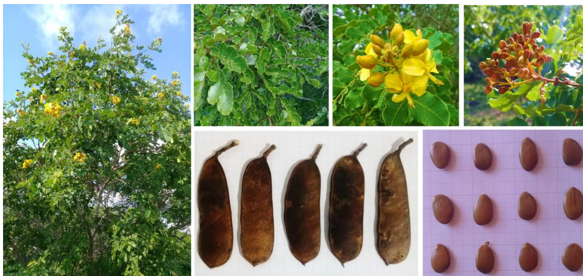
Figura 3 Detalhes do porte, folha, flor, fruto e semente de plantas de Poincianella pyramidalis coletadas em áreas de mata nativa do Bioma Caatinga.