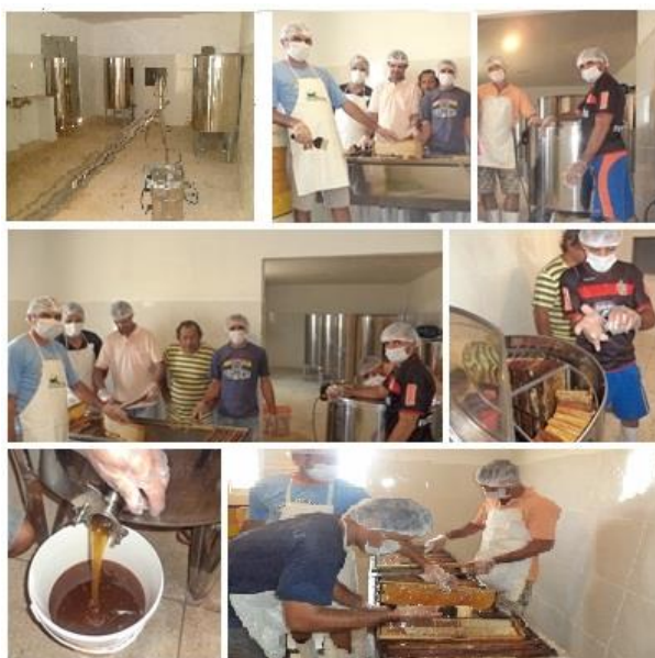
Figura 1: Cooperados trabalhando na produção do mel.

Percebe-se ainda a importância dos incentivos que a cooperativa vem tendo nesses últimos anos, pois, conforme Brandsen e Johnston (2018), para ter um desenvolvimento econômico significativo, é necessário buscar meios que possibilitem a CAPIR a produzir uma maior quantidade de mel e de seus derivados, como também repassar para o comércio um produto de melhor qualidade. A Figura 1 mostra como é feito o trabalho de produção de mel pelos cooperados.