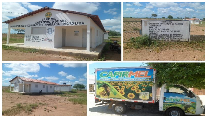
Figura 2: Minientrepasto de mel e caminhão.

A Figura 2 mostra o minientrepasto de mel adquirido por meio do Projeto Cooperar da Paraíba e o veículo utilitário (caminhão baú) adquirido por intermédio da Fundação Banco do Brasil.