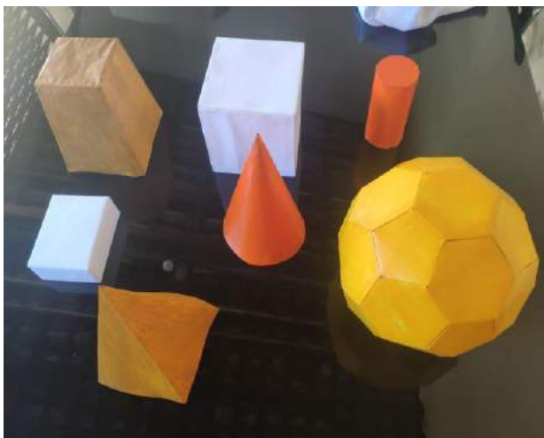
Figura 01: Atividade desenvolvida pelos alunos no LEM sobre os sólidos geométricos

Foi pedido também para que aqueles que tiveram experiências no Laboratório que destacassem as atividades que lembravam desenvolvidas mais interessantes no Laboratório da escola. O Professor A, destacou a Construção de sólidos geométricos (figura 01); O Professor B disse que sua atividade mais importante foi a construção de um teodolito; O Professor C relatou que a atividade que os alunos acharam mais interessante foi o Jogo do quadrado perfeito e o Professor D falou de um jogo sobre Funções.