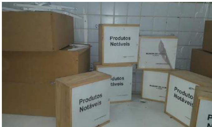
Figura 04: Materiais Didáticos: produtos notáveis

outros se encontram largados e embaixo de muitas caixas. A desorganização é surpreendentemente, dificultando, assim, o manuseio para registrarmos em fotos.