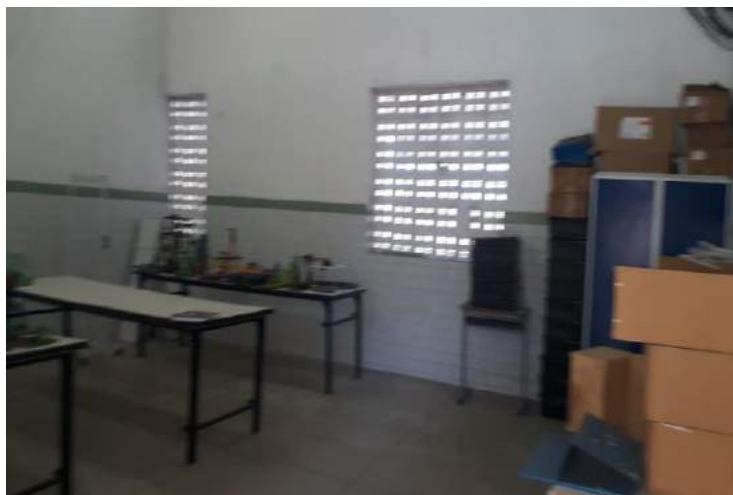
Figura 02: Laboratório de Matemática da escola pesquisada

Todos os professores relataram que a falta de estrutura física das salas dos Laboratórios não acomoda bem os alunos, e também da falta de limpeza da sala, que não é feita todos os dias. Apesar do material riquíssimo disponibilizado para trabalho, é notória a desorganização e o descaso em que este ambiente se encontra, como mostram as figuras 02 e 03.