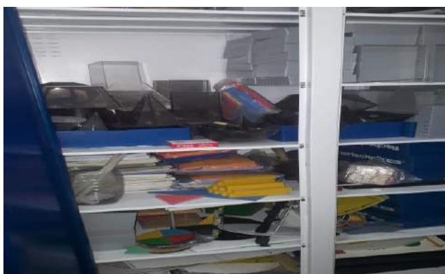
Figura 05: Os materiais didáticos