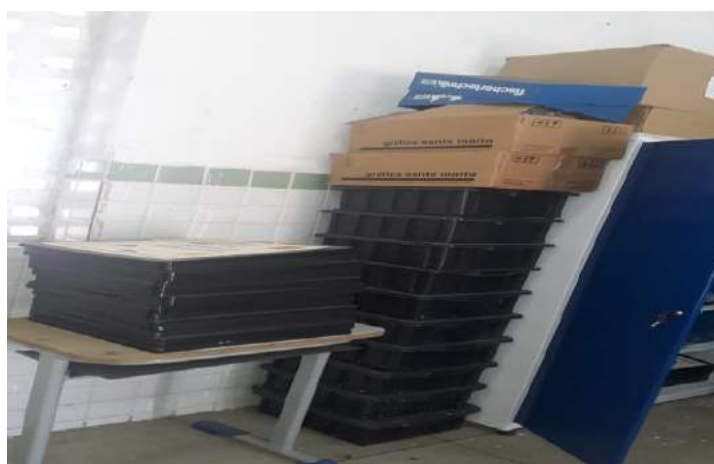
Figura 03: Caixas contendo alguns Materiais Didáticos