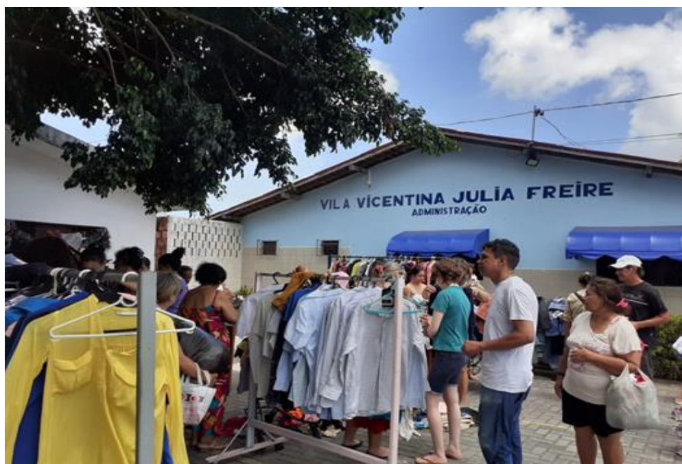
Figura 6: Fotos do Bazar realizado em 07/11/2024

Além disso, a ampla divulgação fez com que no dia do evento houvesse veiculações em três emissoras de televisão e empresas de telecomunicação, o que aumentou o engajamento da comunidade. Também foram convidados proprietários de brechós e bazares em João Pessoa a doarem itens como a participarem do evento. Essas ações em conjunto resultaram em um terceiro bazar, ocorrido em 07/11/2024, que contou com grande público e aumento significativo das vendas (Figura 6).