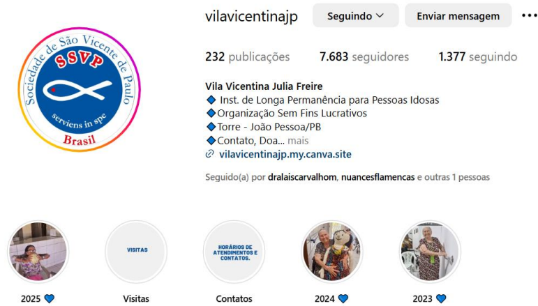
Figura 2: Perfil da Vila Vicentina no Instagram