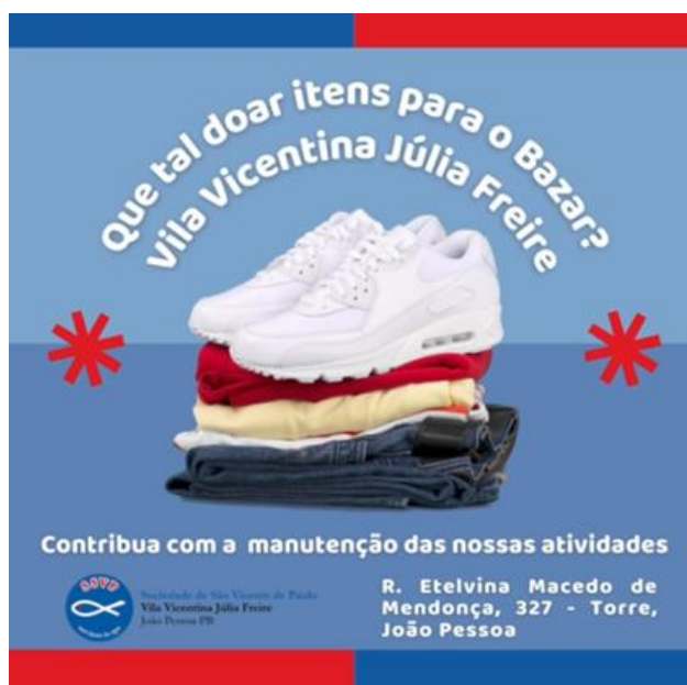
Figura 7: Campanha de donativos para itens do Bazar