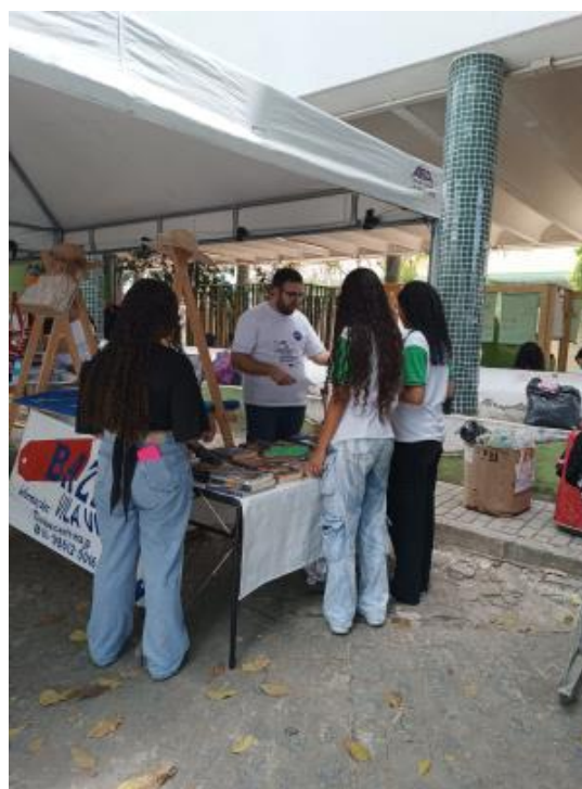
Figura 8: Foto 02 Bazar IFPB (2024)