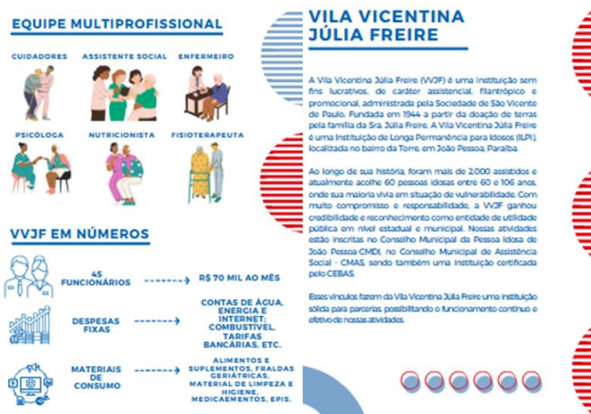
Figura 4: Trechos do Folder Institucional da VVJF