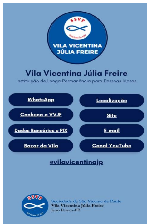
Figura 3: Bio interativa no perfil da Vila Vicentina