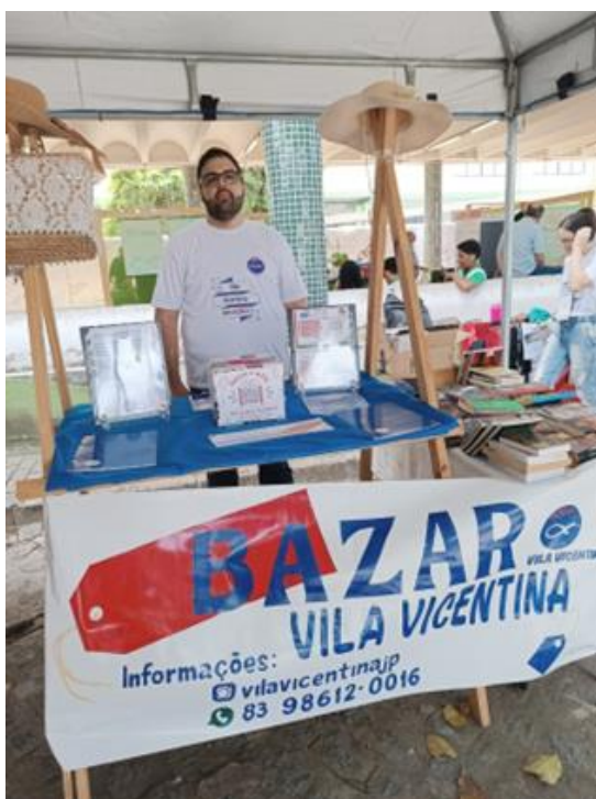
Figura 7: Foto 01 Bazar IFPB (2024)