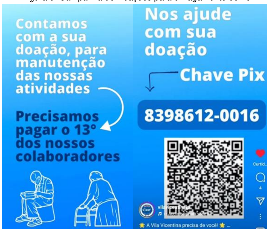
Figura 5: Campanha de Doações para o Pagamento do 13º