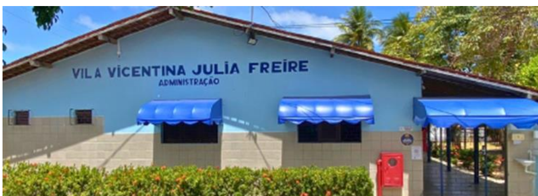
Figura 1: Fachada da Instituição

Este trabalho descreve as ações realizadas durante a experiência do autor como voluntário, durante o período de 28/09/2024 a 28/01/2025, na Vila Vicentina Júlia Freire, uma instituição de longa permanência para idosos, filantrópica e localizada no bairro da Torre, na cidade de João Pessoa/PB, conforme Figura 1.